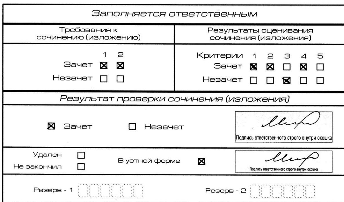
Рис. 10. Область для оценки работы сочинения (изложения) в устной форме

После окончания заполнения бланка регистрации ответственное лицо ставит свою подпись в специально отведенном для этого поле.